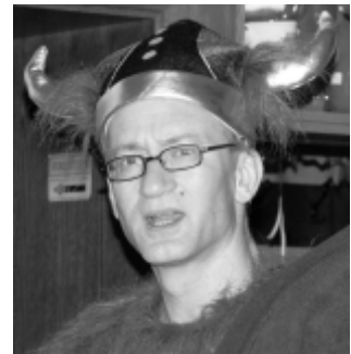
Hägar oder Wicki Benz?