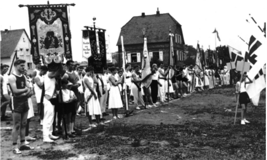
Gauturnfest 1960, Aufstellung der Vereine nach dem Festzug auf dem Festgelände Josefstraße Ecke Jahnstraße.

Wir bitten die Mitglieder, deren Hausnummer sich bei der Straßennamen-Änderung geändert hat, sich per Mail oder per Telefon (1400 donnerstags von 15 - 17 Uhr) kurz zu melden, das am Sportlereingang ausliegende Ummelde-Formular oder das Online Formular auf unserer Homepage zu benutzen.. Vielen Dank